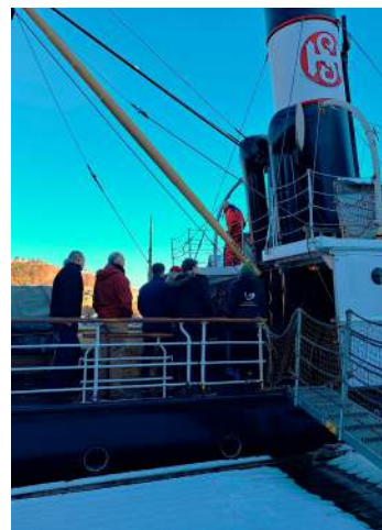
Seminardeltakarar om bord på DS Stord på HFS.

Seminaret har mål av seg til å løfte fram gode eksempel på prosjektgjennomføring og dele nyttig kunnskap.