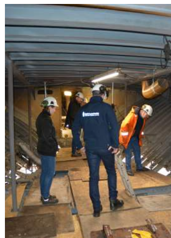
Synfaring av MF Folgefonn på Bredalsholmen