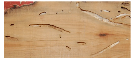
Trestykke fra et fartøy med boreganger fra pælemark.

Pælemark og pælekrepss i "skjønn" forening. De hvite "tubene" er kalkgangene etter pælemarken, og vi ser hvordan pælekrepss har fortært overflata i veden.