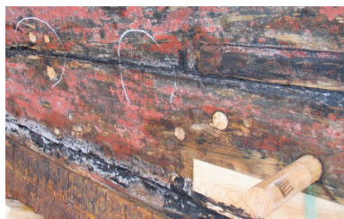
Lekkasjepunkter og spiker utbedret, ny bunnplugg er satt i, og skade i plank spunset

tørt før dette arbeidet. Vær spesielt oppmerksom på kjølnat og spunninger i stevnene. Det blir også fortere dårlig nat i støtene mellom plankene. Det kan være fordelaktig å registrere på et støtskjema hvor kontroll er utført, særlig på store fartøy. Enkelte fartøy kan ha sement over drevet i natene. Dette er ikke å anbefale, da kontroll blir vanskeligere og drevjernene skades. Det er tilfeller der drevet har råtnet helt vekk bak sementen.