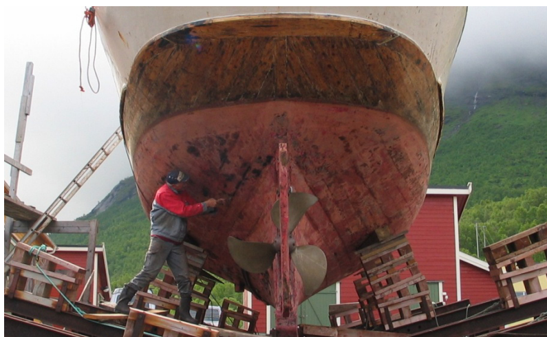
Kontrollering av nater

Dersom man har lekkasjer, eller observerer fuktige områder i nater, kontrolleres disse ved å stikke med kniv, syl eller lignende. Går redskapen inn må det etterdrives. Først fjerner man gammelt bek og lignende med en krok, deretter slår man etter det gamle drevet. Det benyttes så tjæret hamp eller lindrev - i enkelte tilfeller bomullsdrev, som slås direkte på det gamle med drevjern og drevhammer. Over drevet legges bek eller kitt. Skroget må være