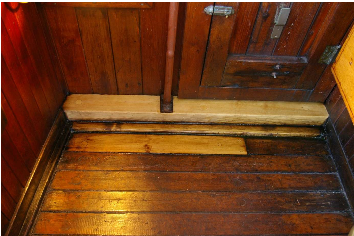
Karm montert med franske skruer ovenpå randplank. Drevet og beket.