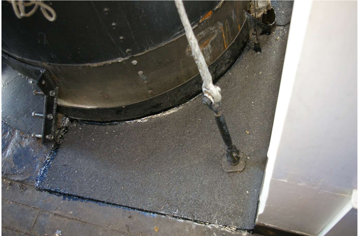
Takpapp er limt på dekket mellom skorstein og bestikklugar.