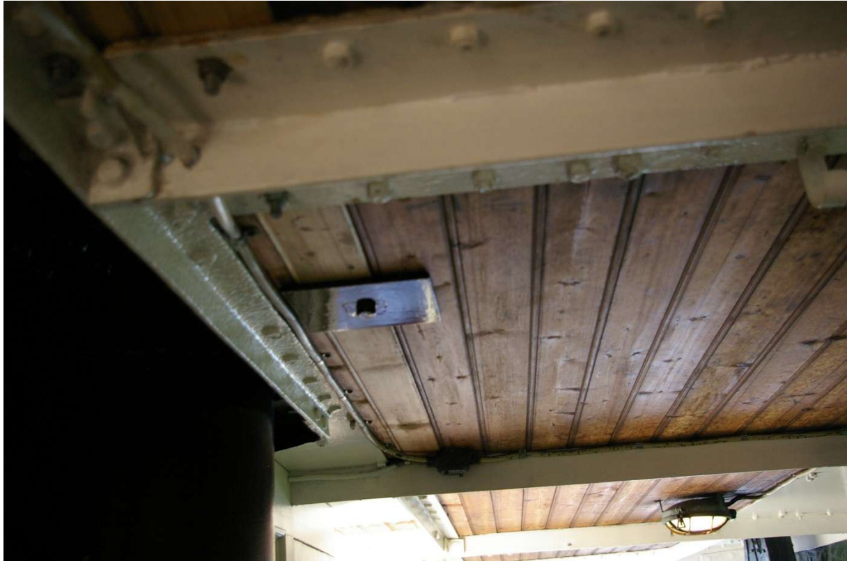
Festebolt til fastgjøring av livbåt med jernplate som rekker over tre dekksplanker.