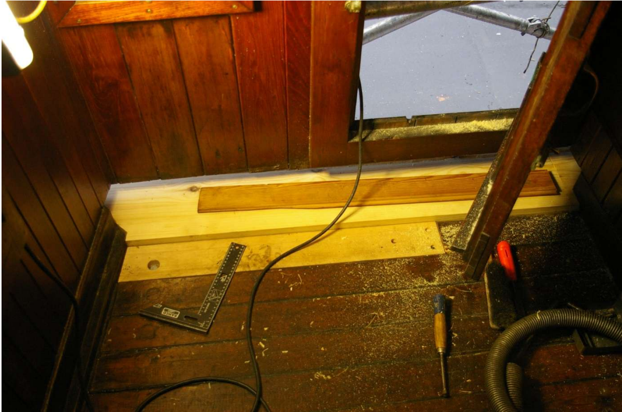
Randplanken skiftet sammen med en kort dekkspanke. Randplanke festet med gjennomgående bolter, dekkspank med gjennomgående bolt og skruer.