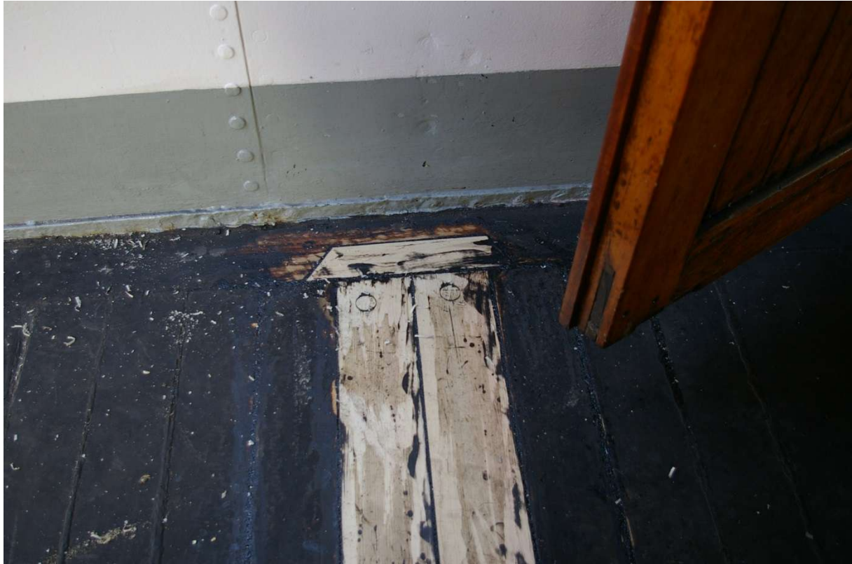
Dekksreparasjon SB- side foran overbygg.