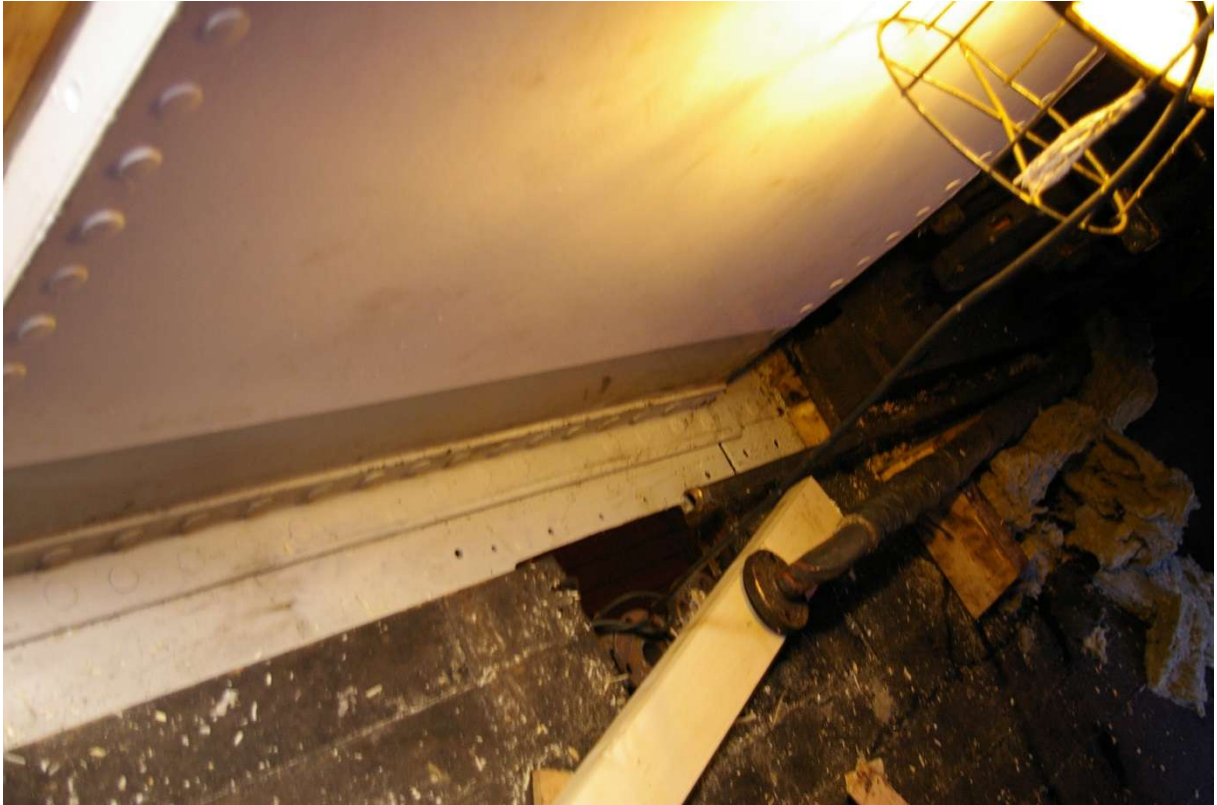
Dekket legges ved siden av nedgangskappen. Vi ser et rør som er demontert