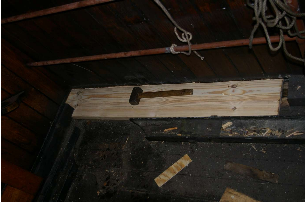
Randplanken går ca. 2 meter ut av styrehuset.