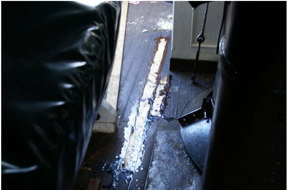
En plank og en kort stump ble skiftet på BB side på båtdekket. Festet med gjennomgående bolter.