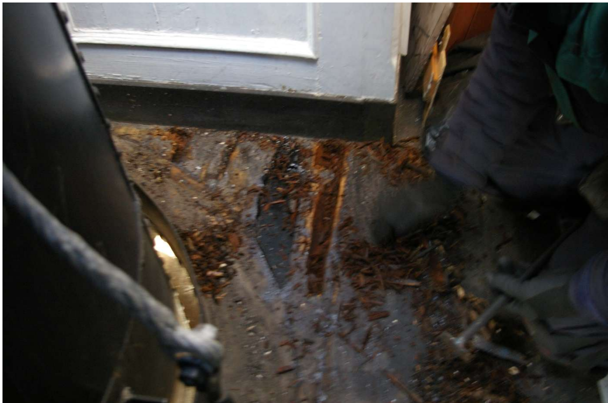
Råttent dekk mellom skorstein og bestikkugar. Gjennomgående bolter.