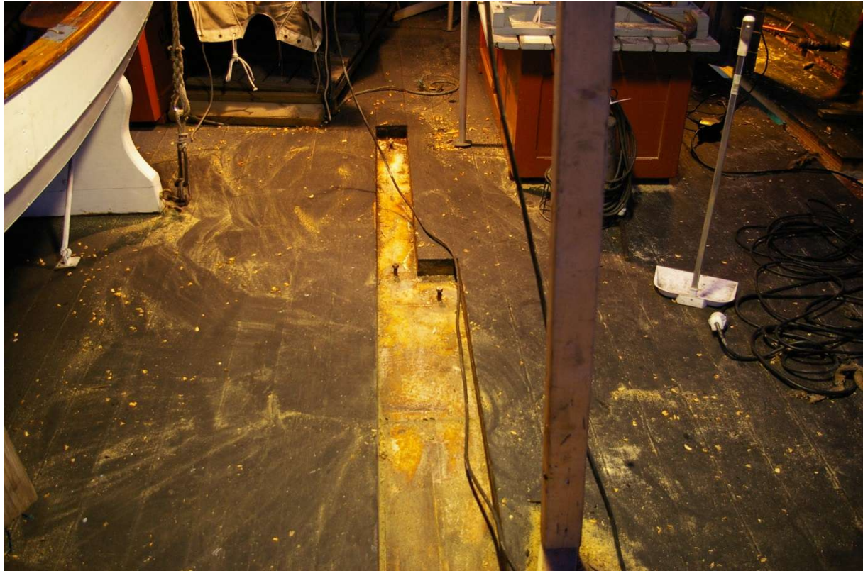
Vi ser to av tre dekksplank som er demonterte i SB side på promenadedekket. Vi ser også noen av de sveiste bolter.