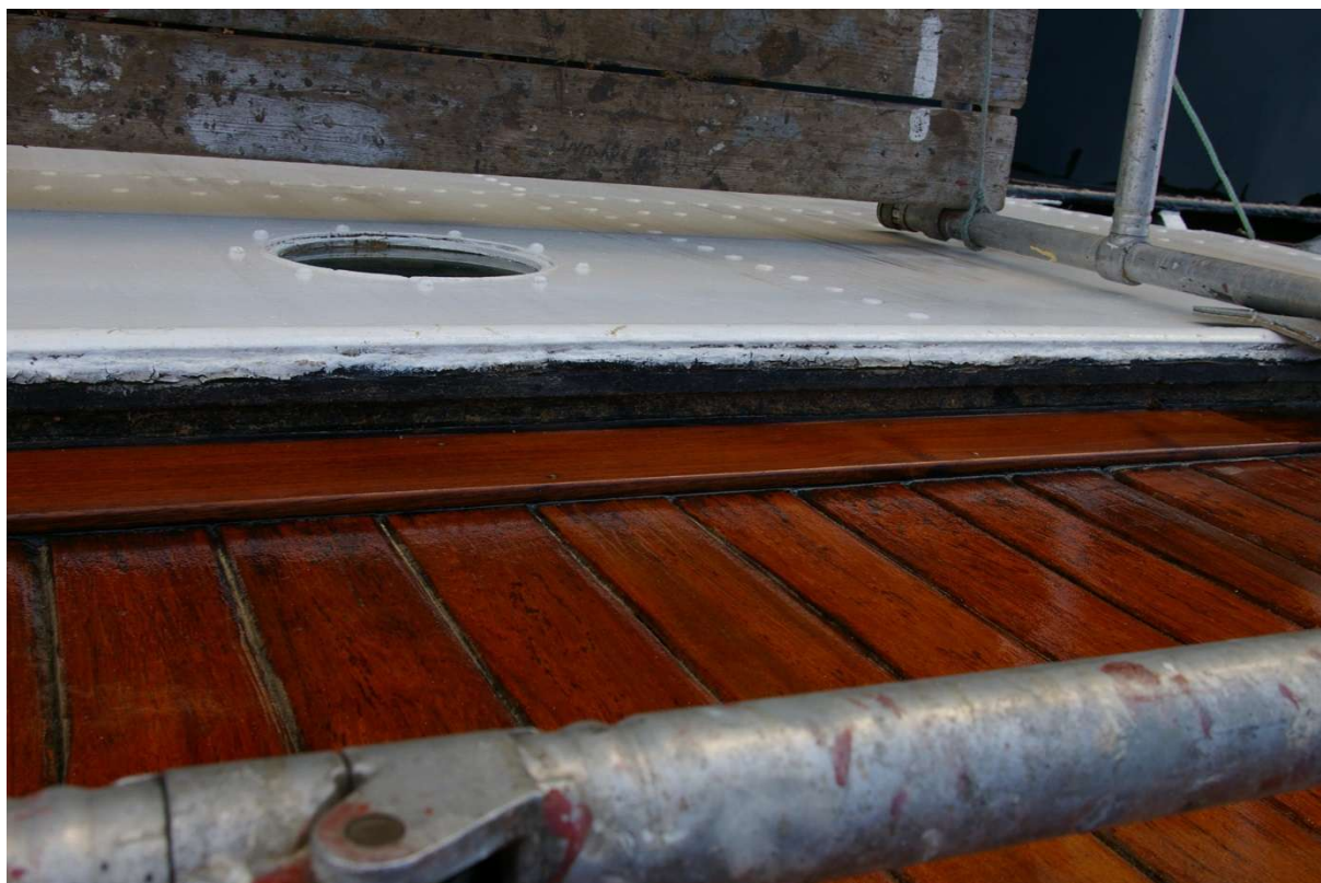
Utvendig fotlist i teak ble skiftet.