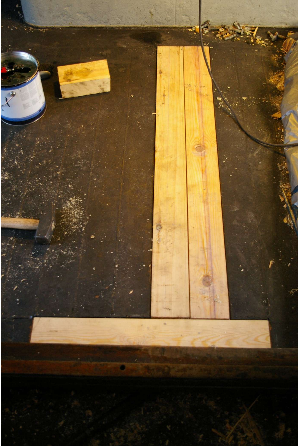
Nye dekksplank mellom overbygg og lasteluke. Gjennomgående bolter.