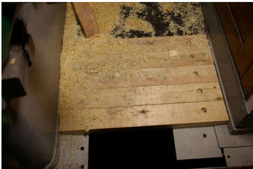
Dekket mellom nedgangskappen og lasteluken skiftes. Festet med gjennomgående dekksp bolter.